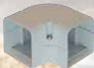
platte bocht 90°

MaxiCool® levert alle onderdelen voor een super de luxe afwerking van leidingen etc. op bijgaande afbeelding ziet u dat kabels en leidingen indien gewenst keurig kunnen worden afgewerkt.