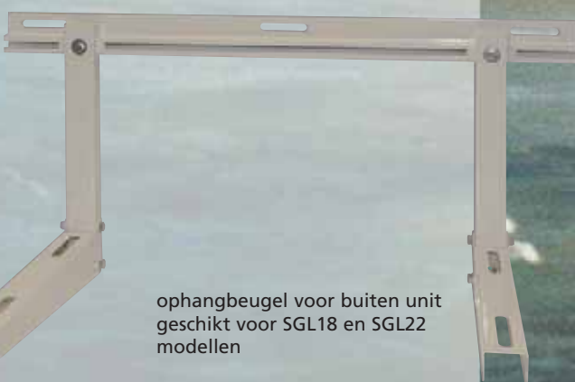
ophangbeugel voor buiten unit geschikt voor SGL18 en SGL22 modellen