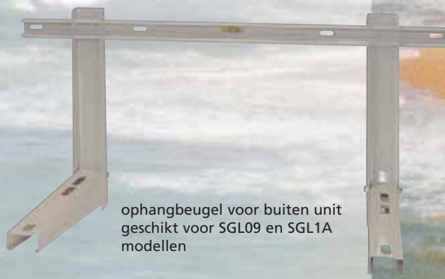
ophangbeugel voor buiten unit geschikt voor SGL09 en SGL1A modellen