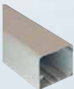
kanalen voor koel- en elektrische leidingen

Uw dealer en installeteur adviseren u op maat betreffende de voor u beste oplossing.