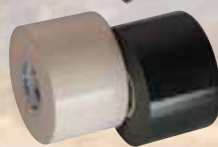
afwerktape klevend 20 meter x 50 mm