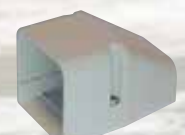
einstuk voor kanaal